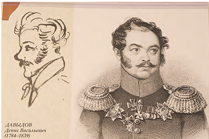
ДАВЫДОВ Денис Васильевич (1784-1839)